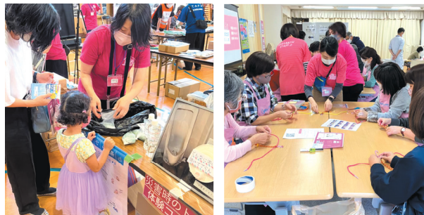
体験ミニワークに取り組む参加者をサポート わかりやすく伝えるためのアイデアを出し合い、実践しています