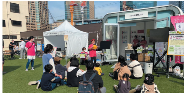
イベントへの出展 展示・体験ブースの運営、パネルシアターを実施