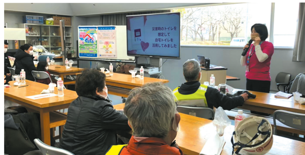
地域の会合で出張講座 動画やスライドを活用してレクチャーします