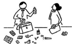
100均で集めた防災 グッズ・持ち出し袋紹介