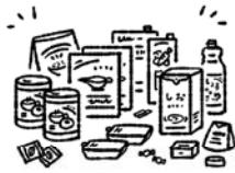
家族で7日間生き抜く 備蓄物資の数量を知る