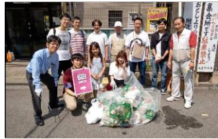
地域の清掃など 毎月の集まりに合わせて