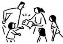
防災絵本「こんなとき どうする？」読み聞かせ