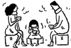
アルファ化米の 炊き出しと試食