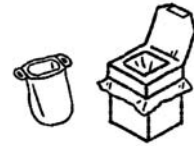
災害用の携帯トイレの 使い方紹介と体験