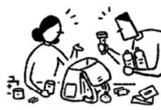
非常持ち出し袋紹介 (乳幼児連れママ、 子ども用、大人用など)