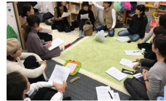
仲間とのミーティング時間 に合わせて