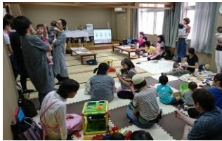
子育てサロンで子どもを遊ばせながら