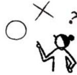
役立つ防災知識の ○×クイズ