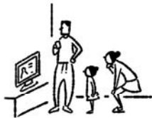
南海トラフ巨大地震の 被害想定動画視聴