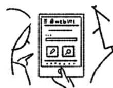
災害用伝言板(WEB171) 使い方紹介と実践